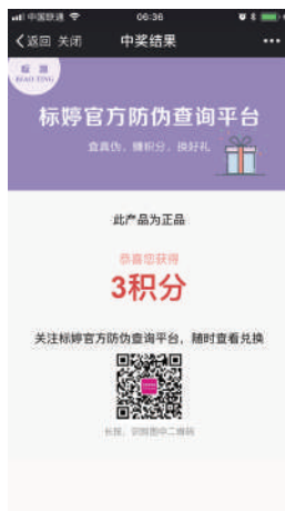
查询真伪的同时获取积分