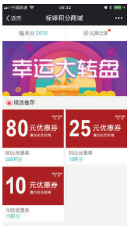
积分商城抽奖兑换